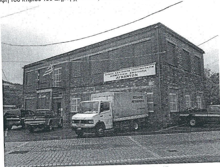
Σχήμα 4.1. Νότια άποψη Εισόδου

Η άποψη του κτιρίου του Δημαρχείου παρουσιάζεται στις φωτογραφίες που ακολουθούν.