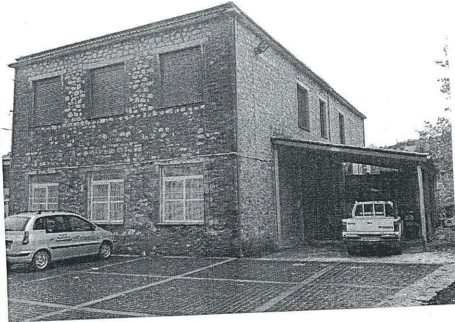
Σχήμα 4.2. Ανατολική άποψη κτιρίου Δημαρχείου