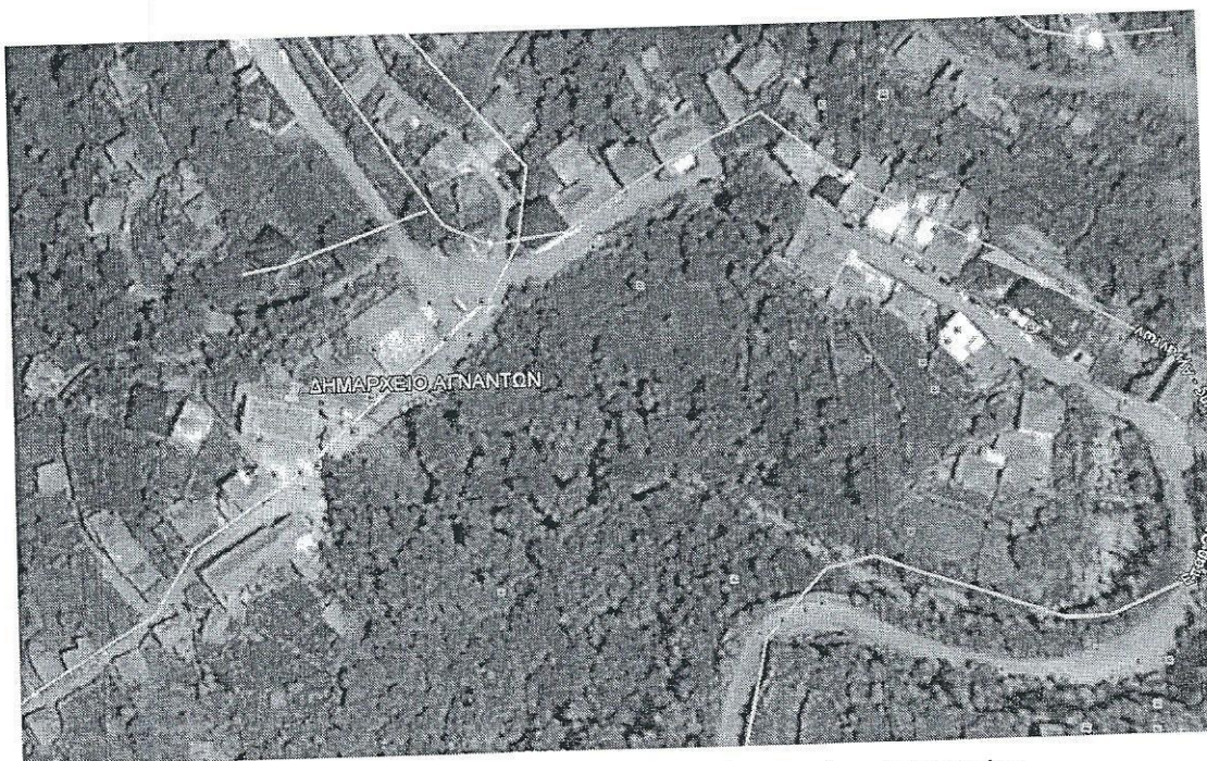
Σχήμα 2.1. Αεροφωτογραφία θέσης πρώην Δημαρχείου

Η θέση τοποθέτησης του κτιρίου απεικονίζεται στο Σχήμα 2.1.