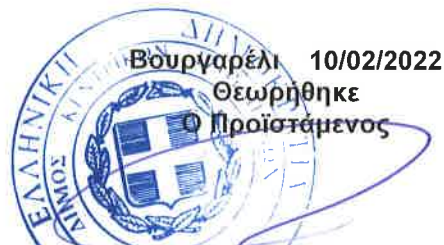
ΙΩΑΝΝΗΣ ΜΑΥΡΙΚΗΣ ΗΛΕΚΤΡΟΛΟΓΟΣ ΜΗΧΑΝΙΚΟΣ ΤΕ