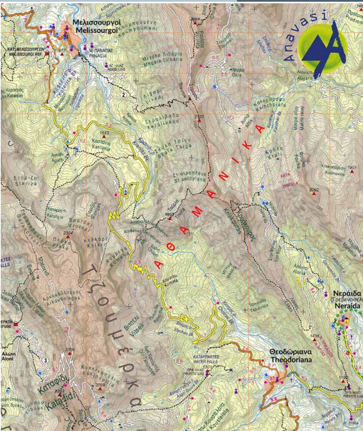
Τμήμα από τον χάρτη Περιστέρι - Κακαρδίτσα - Τζουμέρκα 1:50000 εκδ. Anavasi (2017).